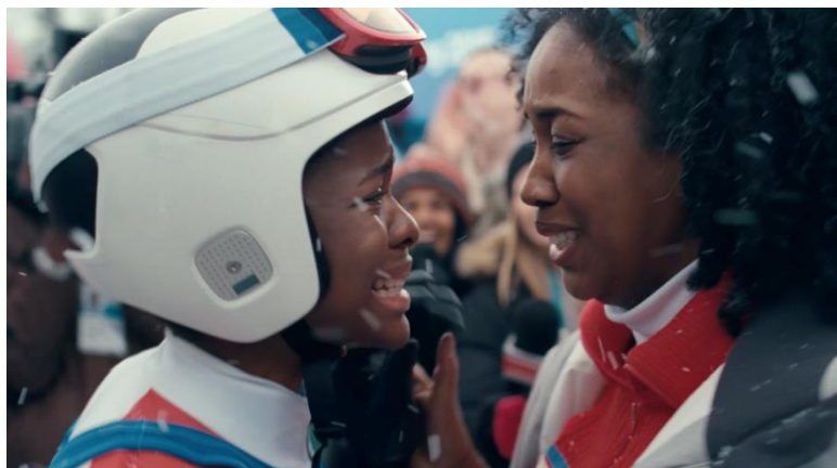
※キャンペーンサイト公開のフルバージョンより

動画は、日本語字幕付きで、「ママの公式スポンサー」キャンペーン公式サイト ( https://www.myrepi.com/lob ) と公式YouTubeチャンネル ( https://youtu.be/iU14crsxKkY ) で、11月17日(金)から公開いたします。また、TV-CM (30秒) は11月17日(金)から全国で放映開始予定です。