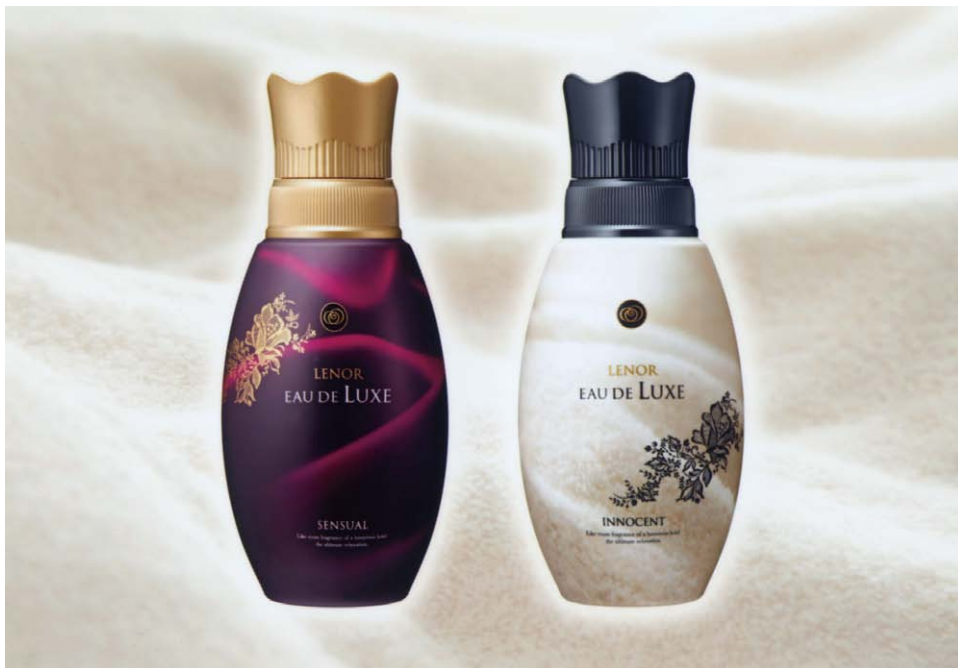
「レノアオードリュクス」(左:同 センシユアル/SENSUAL 右:同 イノセント/INNOCENT)

パリに実在する高級ブティックホテル「ル・パヴィヨン・ドゥ・ラレーヌ」において、大切なゲストへのおもてなしとして実際に使われている香りで、ファブリックを“お手入れ”するという新発想をご提案します。女性的で繊細な香りの「イノセント」と、官能的で上品な香りの「センシユアル」の2種類の香りの展開です。