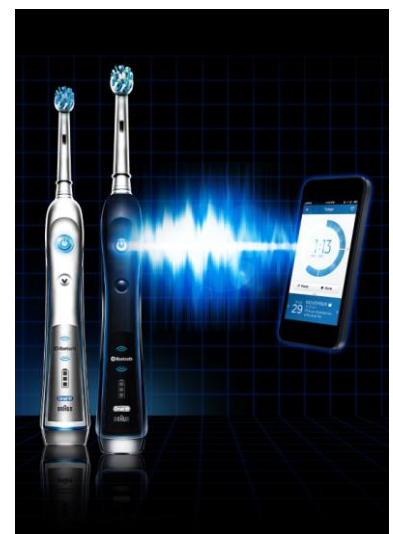
ブラウン オーラルB