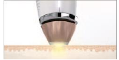
フラッシュボタンを押すと照射します ※照射部分が肌に接していないと、照射されません