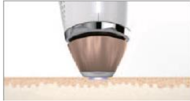
照射部分が肌に接触するようしっかりと当てると LED 出力カバーのライトが光ります