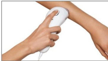
本体を図のように持ちます