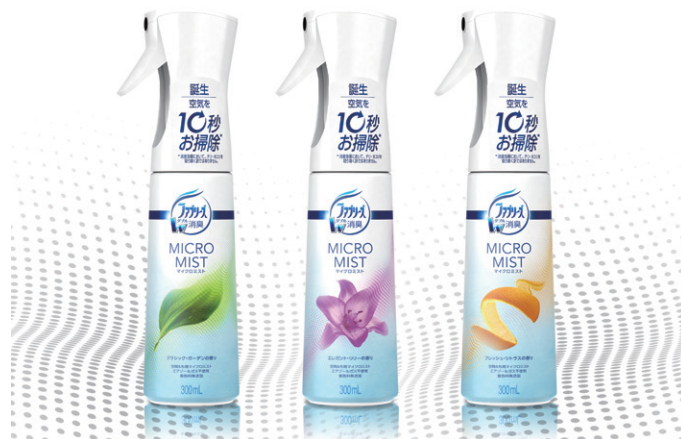
<写真後方左から>ファブリーズ マイクロミスト クラシック・ガーデン、同 エレガント・リリー、同 フレッシュ・シトラス

**：P&Gによる調査（調査対象：子どもを持ち、週3日以上働いている20～50代の女性）2015年9月実施 n=400