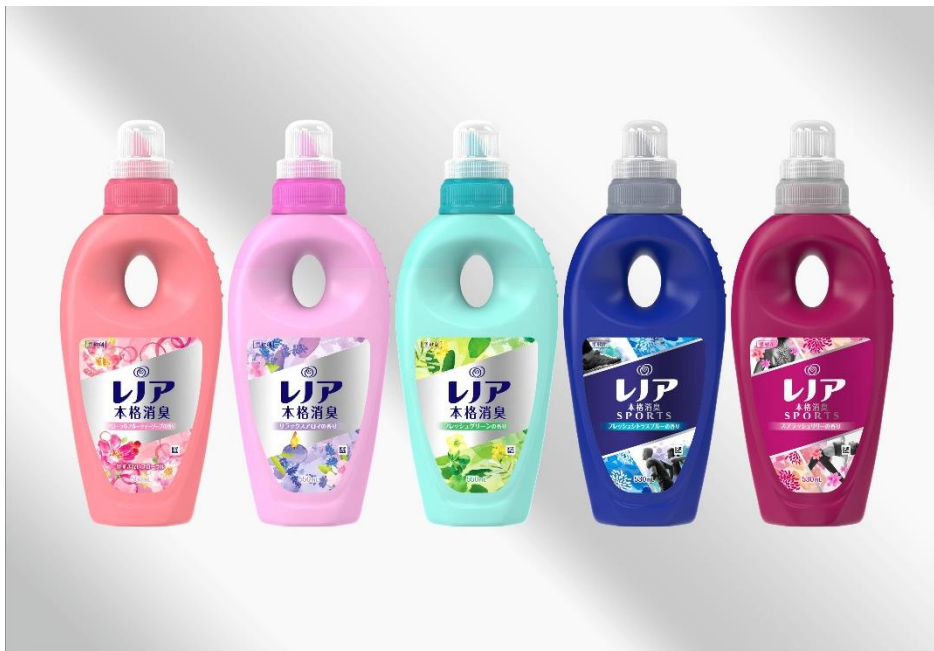
レノア本格消臭/レノア本格消臭スポーツ