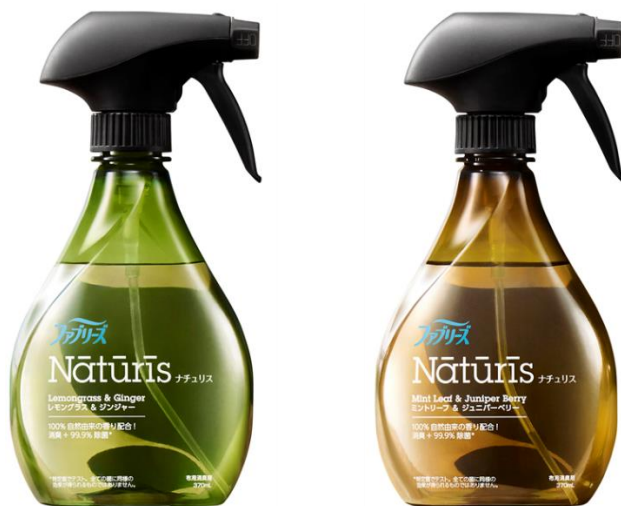
<写真左から>ファブリーズ ナチュリス レモングラス&ジンジャー、同ミントリーフ&ジュニパーベリー