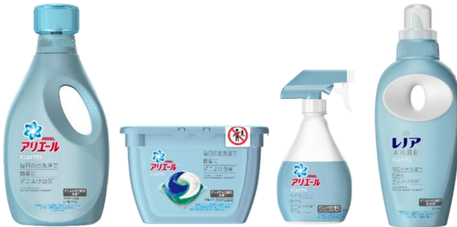
左から、アリエールジェル ダニよけプラス、アリエールジェルボール3D ダニよけプラス、アリエールスプレー ダニよけプラス、レノア本格消臭 ダニよけプラス

*1屋内塵性ダニをよせつけにくくします。すべてのダニ・素材に効果があるわけではありません。洗剤は1回すすぎ洗濯時。洗剤・柔軟剤は、超薄手を除く綿素材に対してダニをよせつけにくくします。詳細はAriel.jpをご覧ください。